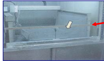
เมื่อปิดเครื่องประตูจะเปิด

4. การติดตั้งเครื่อง Soltrap ที่เครื่อง Washing เพื่อให้สามารถนำสารเคมีที่สูญเสียไปกับระบบระบายอากาศของเครื่องกลับมาใช้ใหม่ (โรงงานบางปะอิน)