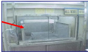
เมื่อเปิดเครื่องประตูจะปิด

3. การติดตั้งประตู Shutter สำหรับเครื่อง Spray coat เพื่อป้องกัน Air เย็น ไม่ให้ถูกดูดออกไป ทำให้ สามารถประหยัดพลังงานได้ (โรงงานบางปะอิน)