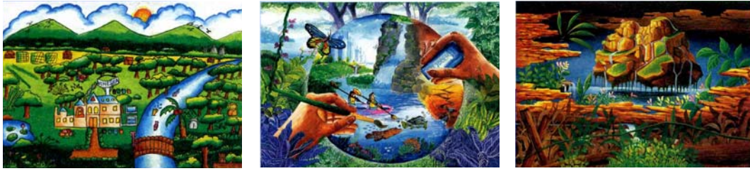
ภาพชนะการประกวด