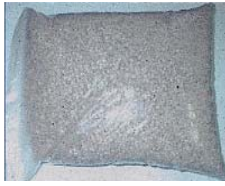
ขอบแผ่น Pet Film ที่เหลือจากการผลิต

1. การนำขอบแผ่น Pet Film ที่เหลือจากการผลิต มาทำการ Recycle เป็นก้อนพลาสติกของแปร่งล้างห้องน้ำ (โรงงานบางปะอิน)