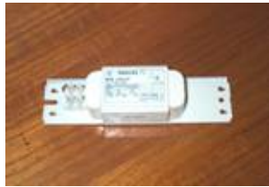
บัลลาสต์แกนเหล็ก

10. เปลี่ยนบัลลาสต์แกนเหล็ก เป็นบัลลาสต์อิเล็กทรอนิกส์ เพื่อลดปริมาณการใช้ไฟฟ้าในระบบแสงสว่างที่อาคาร 1 ชั้น 2 (โรงงานลพบุรี)