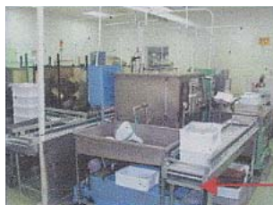
การติดตั้งถาดรองรับน้ำมัน

5. การติดตั้ง Roller Conveyor ที่มีถาดรองรับน้ำมันหยดด้านล่าง ในขณะที่เคลื่อนย้ายภาชนะใส่ชิ้นงาน เพื่อเป็นการแก้ไขปัญหา น้ำมันหยดลงบนพื้น (โรงงานบางปะอิน)